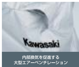
内部換気を促進する 大型エアーベンチレーション

フューエルタンク脇に2箇所のエアーベンチレーションを新設、内部の換気を促進し蒸れを防ぎます。また風雨に耐えるためのワンタッチジョイントやハンドルロック状態を想定しての立体裁断、盗難防止用ロック穴を前後に設けるなど機能満載の商品です。