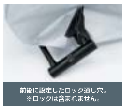
前後に設定したロック通し穴。 ※ロックは含まれません。