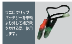
ワイドクリップ バッテリーを車載 より外して補充電 をかける際、使用 します。